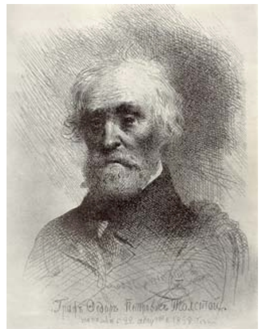
Т. Г. Шевченко Портрет Ф. П. Толстого 1860

Внизу зеркально расположенная подпись художника: "Т. Шевченко. 1860". Ниже под портретом: "Граф Федор Петрович Толстой. На память 22 августа 1858 года"