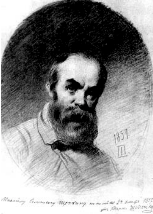
Т. Г. Шевченко Автопортрет 1857

На портрете внизу авторская дата и монограмма художника: "1857. Ш." Под изображением дарственная надпись: "Михаилу Семеновичу Щепкину, на память 24 декабря 1857 года от Тараса Шевченко"